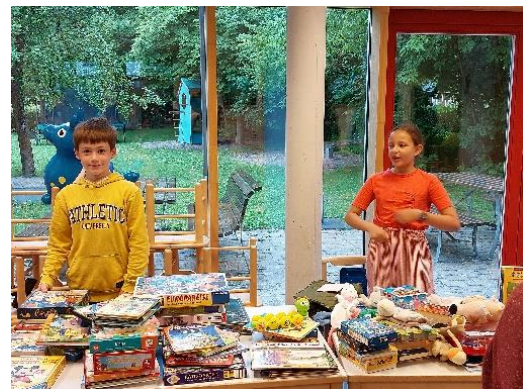
Foto links: Die Eröffnung unseres Eine-Welt-Festes mit dem Lied „Dieses Lied kennt jedes Kind“ /