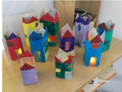
Foto: Die Martinslaternen aus alten Milchtüten