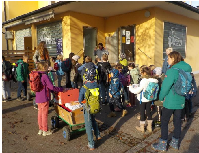
Foto: Wir spazieren bepackt mit den gesammelten Lebensmitteln zur Tafel Burghausen