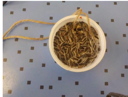
Fotos: Unser selbstgemachtes Vogelfutter