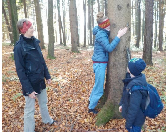
Foto: wir erspüren die Baumrinde mit verbundenen Augen.