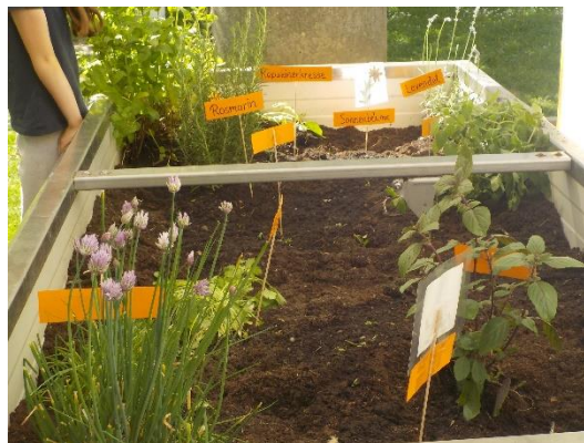
Foto: Unser Kräuterbeet