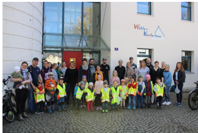
Foto: Einige fleißige Helfer mit ihren Eltern und Betreuern