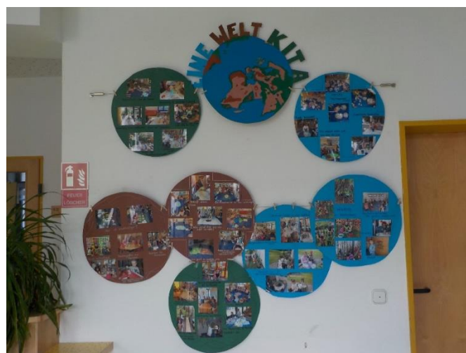
Foto: verschiedene Aktionen bildlich dokumentiert